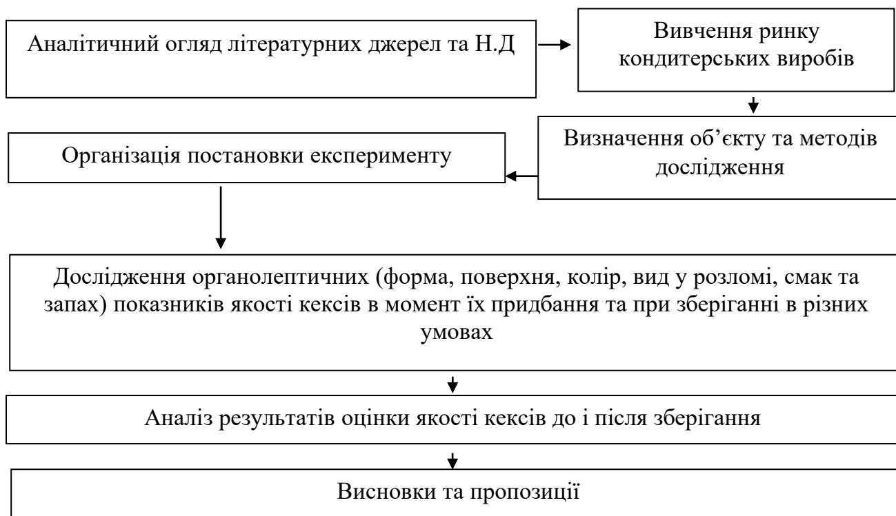
Рисунок 2.1 – Схема організації постановки експерименту